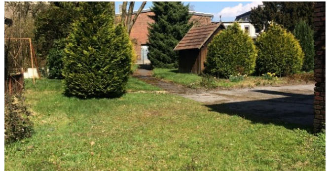
Lage für Einfamilienhaus